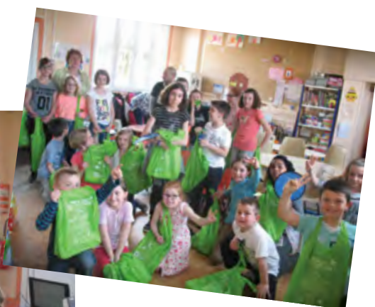
Intervention du service environnement au périscolaire de Caisnes