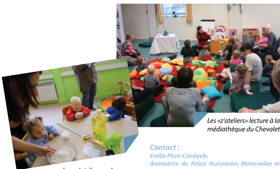
Les «z'ateliers» lecture à la médiathèque du Chevalet