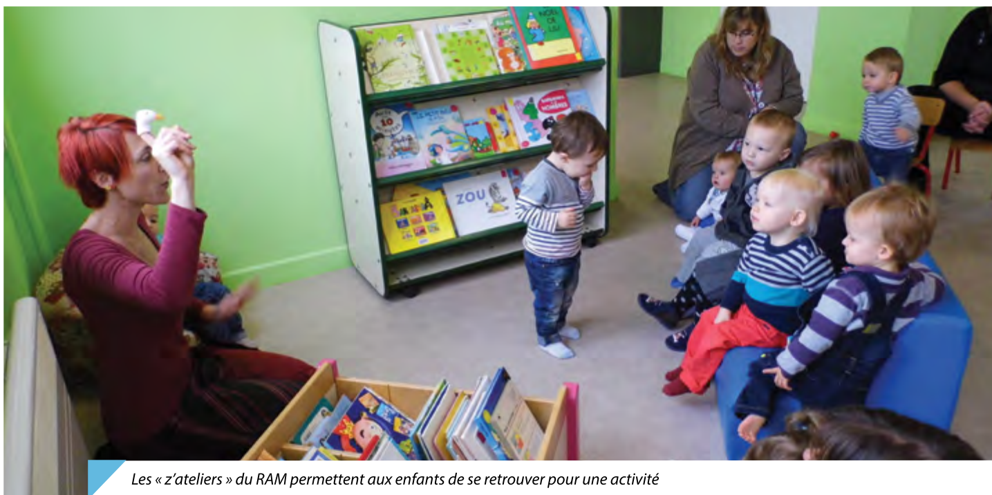
Les « z'ateliers » du RAM permettent aux enfants de se retrouver pour une activité

Parallèlement, des réunions de travail sont proposées en soirée ou le samedi matin, pour aborder un thème défini les concernant (la déclaration fiscale a été abordée au mois d'avril). Un organisme de formation est également intervenu pour leur présenter les modalités d'accès au « droit à la formation ». En septembre prochain, douze assistantes maternelles participeront à la formation « Santé au travail ! »