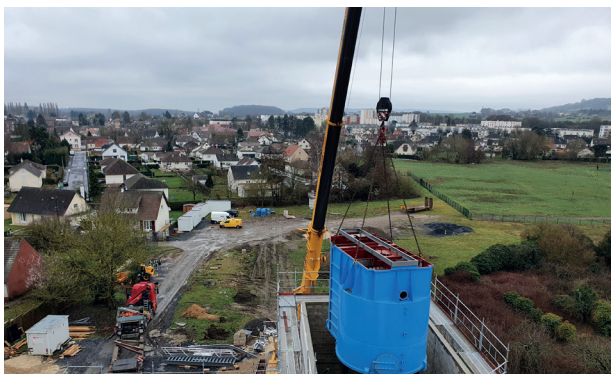
Installation du densadag, pièce maîtresse de l'unité de décarbonatation. Elle permet d'éliminer la dureté de l'eau avec un réacteur de recirculation des boues.