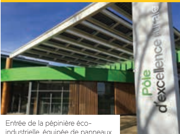
Entrée de la pépinière éco-industrielle, équipée de panneaux photovoltaïques, à Inovia

Quartier militaire accueillant 1 200 hommes il y a encore 6 ans, aujourd'hui le site est devenu Inovia, un espace d'activités, qui incarne la reconstruction du tissu industriel noyonnais et de l'économie locale. Bénéficiant de subventions de l'Europe, de l'Etat, de la Région et du Département, le campus économique accueille aujourd'hui une soixantaine d'entreprises (250 salariés) et des organismes de formation, comme l'école du numérique, qui feront les métiers de demain.